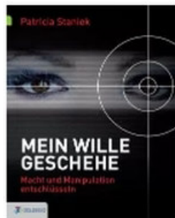
„Mein Wille geschehe“, erschienen im Goldegg Verlag

Lässt du dich manchmal auf etwas ein, obwohl du es gar nicht willst? Lässt dir von deinem Chef oder deiner Kollegin noch eine Aufgabe geben, obwohl du eigentlich gar keine Zeit dafür hast. Zum wiederholten Male sagst du nicht „Nein“, obwohl du es dir vorgenommen hast? Haben andere Menschen einen Einfluss auf dich, den du dir nicht erklären kannst?