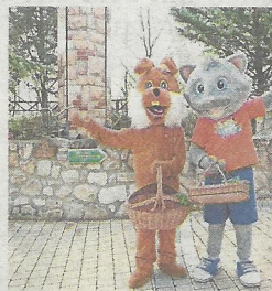
Der Osterhase und Filippo sich auf den Saisonstart

Von 30. März - 1. April sorgen an 3 Tagen der Osterhase höchstpersönlich, Maskottchen Filippo und die lustigen Stelzengänger für österliches Treiben. Unser Zauberer verblüfft euch mit magischen Einlagen, während ihr euch bei unserer Bastelstation kreativ austoben könnt. Es erwartet euch auch ein Osterrätsel, bei dem es wieder tolle